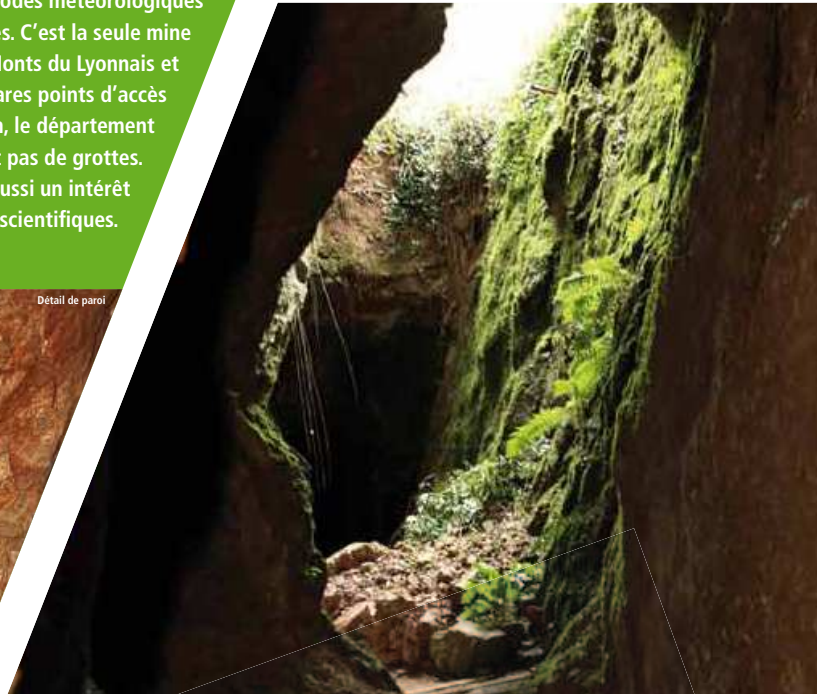
Détail de paroi

La Réserve Naturelle Régionale de la mine du Verdy offre aux chauves-souris un gîte de refuge et de tranquillité pendant l'hibernation et lors de périodes météorologiques défavorables. C'est la seule mine d'importance des Monts du Lyonnais et un des rares points d'accès au milieu souterrain, le département du Rhône n'ayant pas de grottes. Elle présente aussi un intérêt pour les scientifiques.