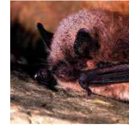
Murin à moustaches