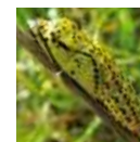
Chrysalide de Fiambé