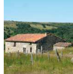
Jasserie et sa cave à fourme

plantes vivaces proches des fougères, dont l'apogée se situe il y a 300 millions d'années, où les lycopodes atteignaient la taille des arbres ! Aujourd'hui, ceux de Colleigne sont rampants et ne dépassent pas 30 cm de hauteur