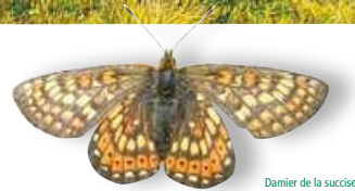
Damier de la succise