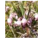
Andromède à feuilles de Polium