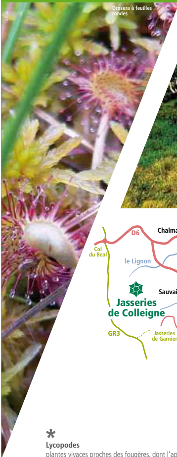
Dróséra à feuilles rondes