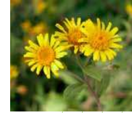
Inule de Suisse