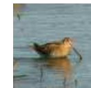
Bécassine des marais