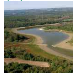
Le grand étang

* Biotope milieu biologique déterminé offrant des conditions d'habitat stables à un ensemble d'animaux et de végétaux